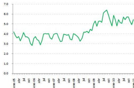
Tasa de desempleo (% de la PEA)

Última actualización el Martes, 07 de Junio de 2011 08:54